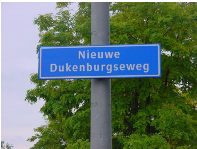
zijstraat Nieuwe Dukenburgseweg; zie kaart